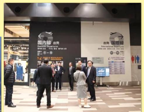
▲ 国際・国内線が同一ビル内にある「阿蘇くまもと空港」