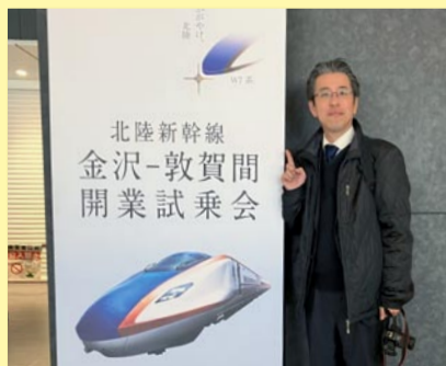
▲ 北陸新幹線試乗会に参加 (敦賀駅)