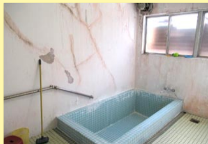
▲ 劣化が目立つ寄宿生用の浴室 (大阪北視覚支援学校)