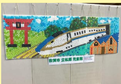
▲ 新幹線開業を記念した作品 (敦賀駅)

北陸新幹線の試乗会に参加しました。金沢一敦賀間には小松、加賀温泉、芦原温泉、福井、えちぜん武生の5駅ができます。敦賀駅の待合室にはペットボトルのキャップで赤レンガ倉庫と由緒ある気比神宮の鳥居を描いた作品が飾ってありました。引き続き新大阪までの全線開業に向け、後押しをしていきます。