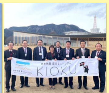
▲ 熊本地震震災ミュージアムで記念撮影