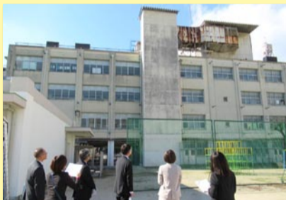
▲ 屋上に残る使わなくなった空調装置 (東淀川支援学校)

2016年4月に大阪市から移管された府立東淀川支援学校、大阪北視覚支援学校を視察しました。両校とも施設の各所に老朽化が見られます。それぞれ知的障がい、視覚障がいの子どもたちの通う大切な学校です。安全・安心に学べる環境づくりを進めていきます。