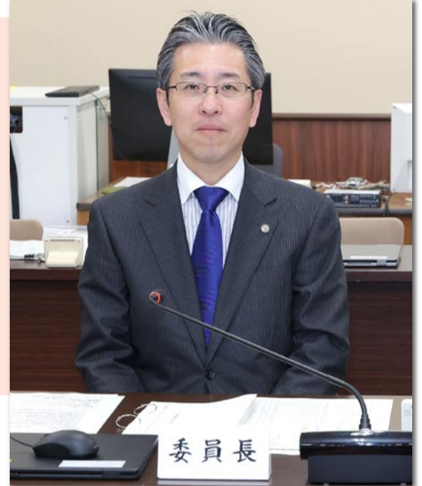
▲ 教育常任委員会を運営

大阪府議会2月定例会は3月12、14、18日の3日間、教育常任委員会が開かれ、高校生向けの奨学金制度の拡充や私立高校の授業料無償化、大阪公立大学のあり方など府政の重要課題が議論されました。