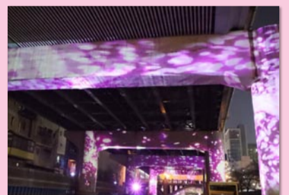
▲ 東横堀川のプロジェクションマッピング

2026年2月ごろまで実施の予定です。ぜひご覧いただき、お楽しみいただければ何よりです。