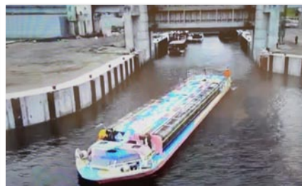
▲ 観光船が淀川ゲートウェイを通過