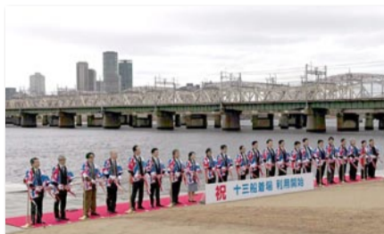
▲ 十三船着場でテープカット

また、流域の公園を活用し、魅力発信をするなど面的な広がりを持たせる、とのこと。これからも十三や淀川舟運の魅力を発揮できるよう取り組んでいきます。