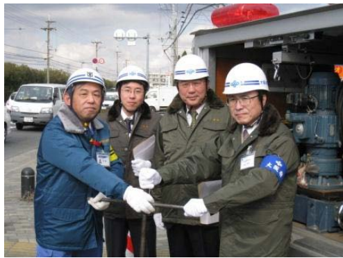
訓練開始に立ち会う加治木府議 (左から2人目)

発行：杉田・加治木事務所 〒532-0012 淀川区木川東 4-5-2 TEL：06-4805-0450 FAX：06-4805-0452