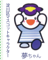
淀川区マスコットキャラクター 夢ちゃん